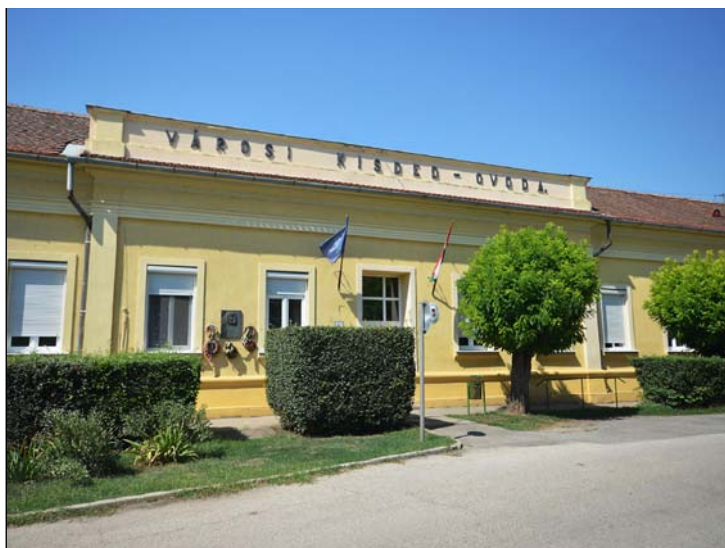
2. számú kép: Az 1896-ban létesült és a mai napig eredeti funkciójában működő városi kisedóvoda Szentesen