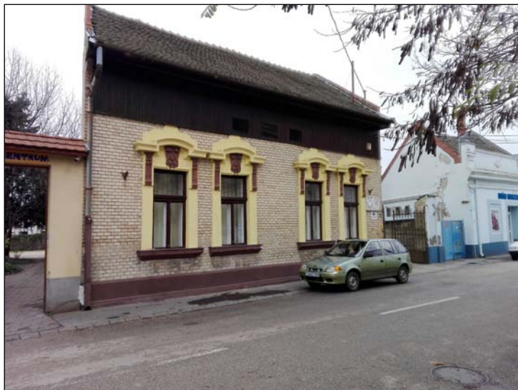
1. számú kép: Az ezen a helyen álló épületben kezdte meg működését 1876-ban a Jótékony Nőegylet által alapított első szentesi kisedóvó